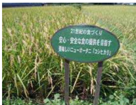
「おおたに こしひかり」