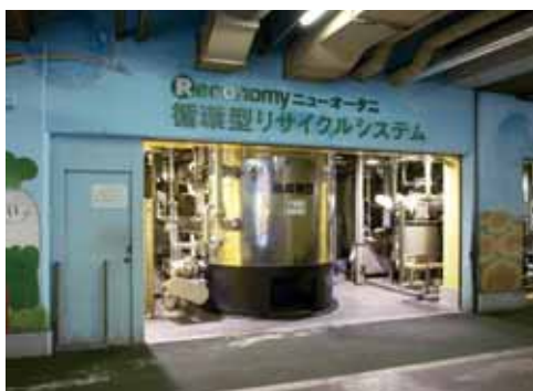
ガーデンタワー1階に設置された 「コンポスト・プラント」

ホテルから出る 1日約 5t もの生ゴミ(食べ物、生花など)は、ガーデンタワー1階に設置した「コンポスト・プラント」で乾燥、発酵させ毎月約 30t の普通肥料を生産しています。その後、堆肥工場で二次発酵させた堆肥の一部を、茨城県の契約農家で米の栽培に使用し、収穫された米「おおたに こしひかり」をホテルの社員食堂などに提供しています。残りの堆肥も農家で利用され、そこで生産された野菜などの一部をホテルが購入しています。このリサイクルシステムの導入により、生ゴミの 100%リサイクルを実現すると同時に、年間で 3,400 万円の生ゴミ焼却処分費が削減されました。