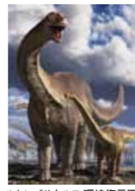
ルヤンゴサウルス 環境復元画

「ギガ恐竜展2017」の入場券とランチやシェルの入場券(14:00~)がついたお得なプランをご用意しました。 販売期間 7/15(土)~9/3(日) ※除外日あり 選べるランチプラン 【大人】¥4,200 【4歳~中学生】¥3,200 ※料金は「ギガ恐竜展2017」入場券、選べるランチ(和・洋・中)、税金・サービス料共 最強日帰りプラン 前日までの予約制 【大人】¥6,000 【中学生】¥5,000 【4歳~小学生】¥4,000 ※料金は「ギガ恐竜展2017」入場券、シェル ザーデン食事券(¥2,500分)、シェルプール入場券、税金・サービス料共