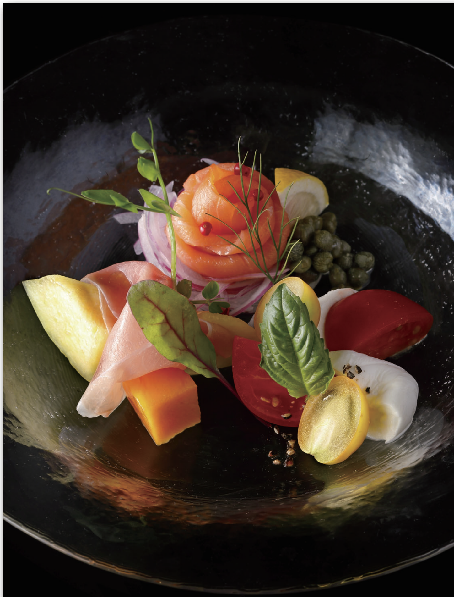
Appetizer Plate 前菜3種盛り合わせ