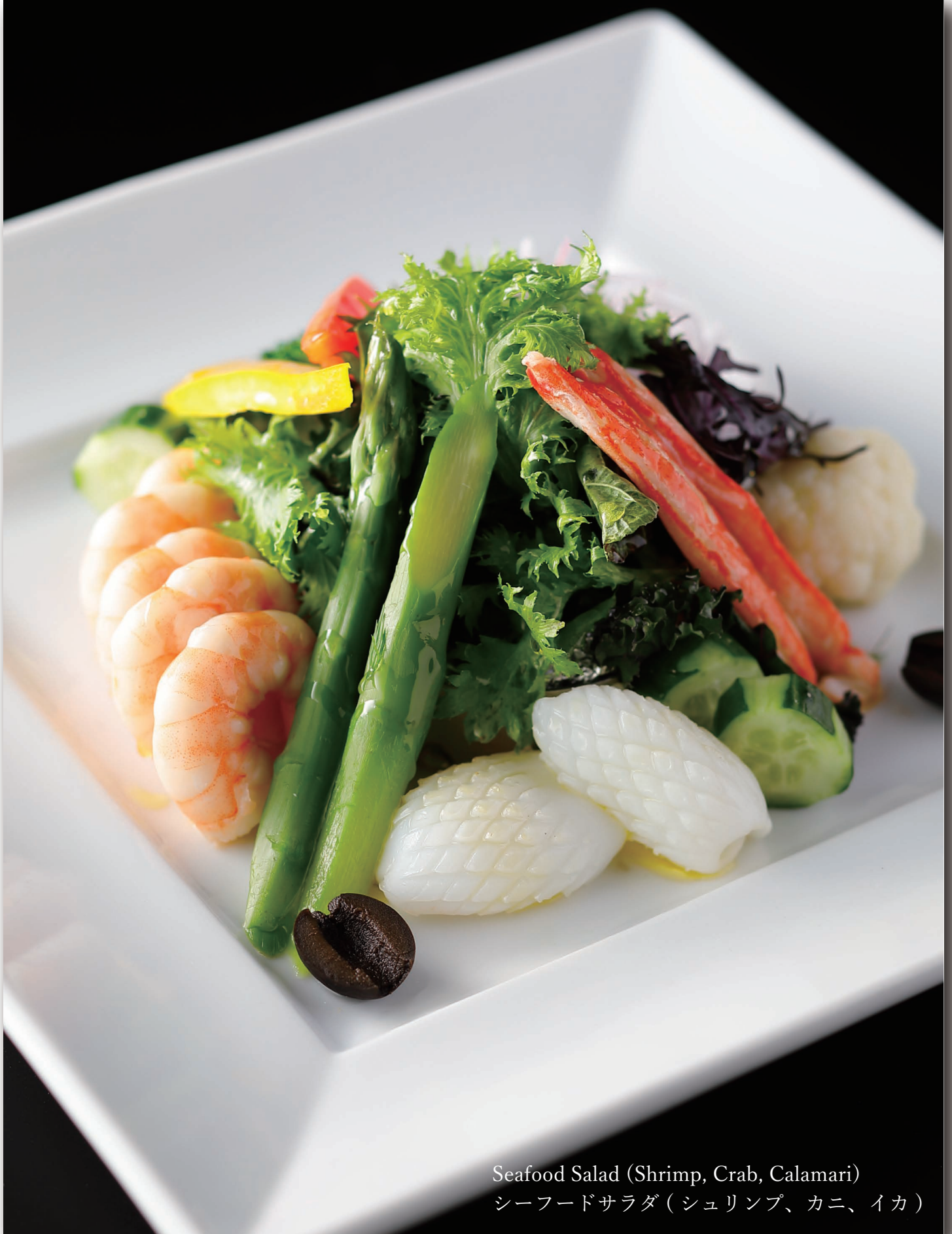
Seafood Salad (Shrimp, Crab, Calamari) シーフードサラダ (シュリンプ、カニ、イカ)