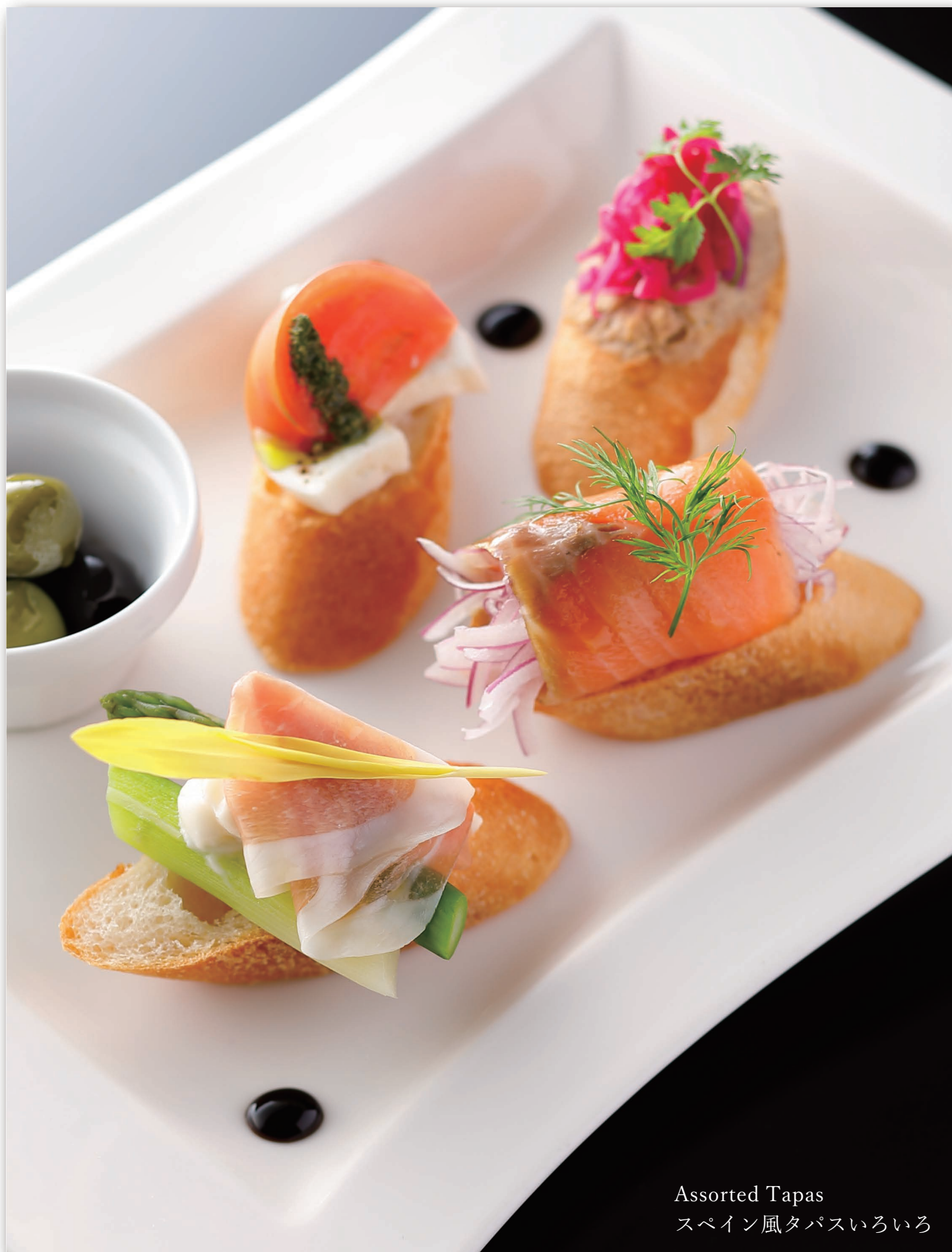
Assorted Tapas スペイン風タパスいろいろ