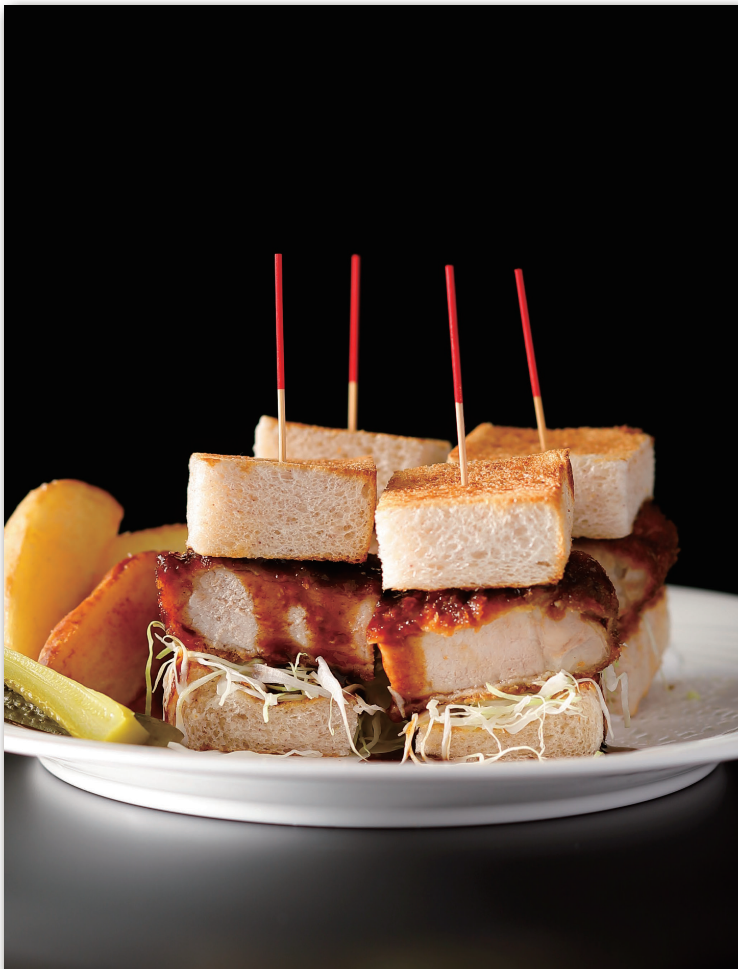
Pork Cutlet Sandwich クラシック ポークカツ サンドウィッチ