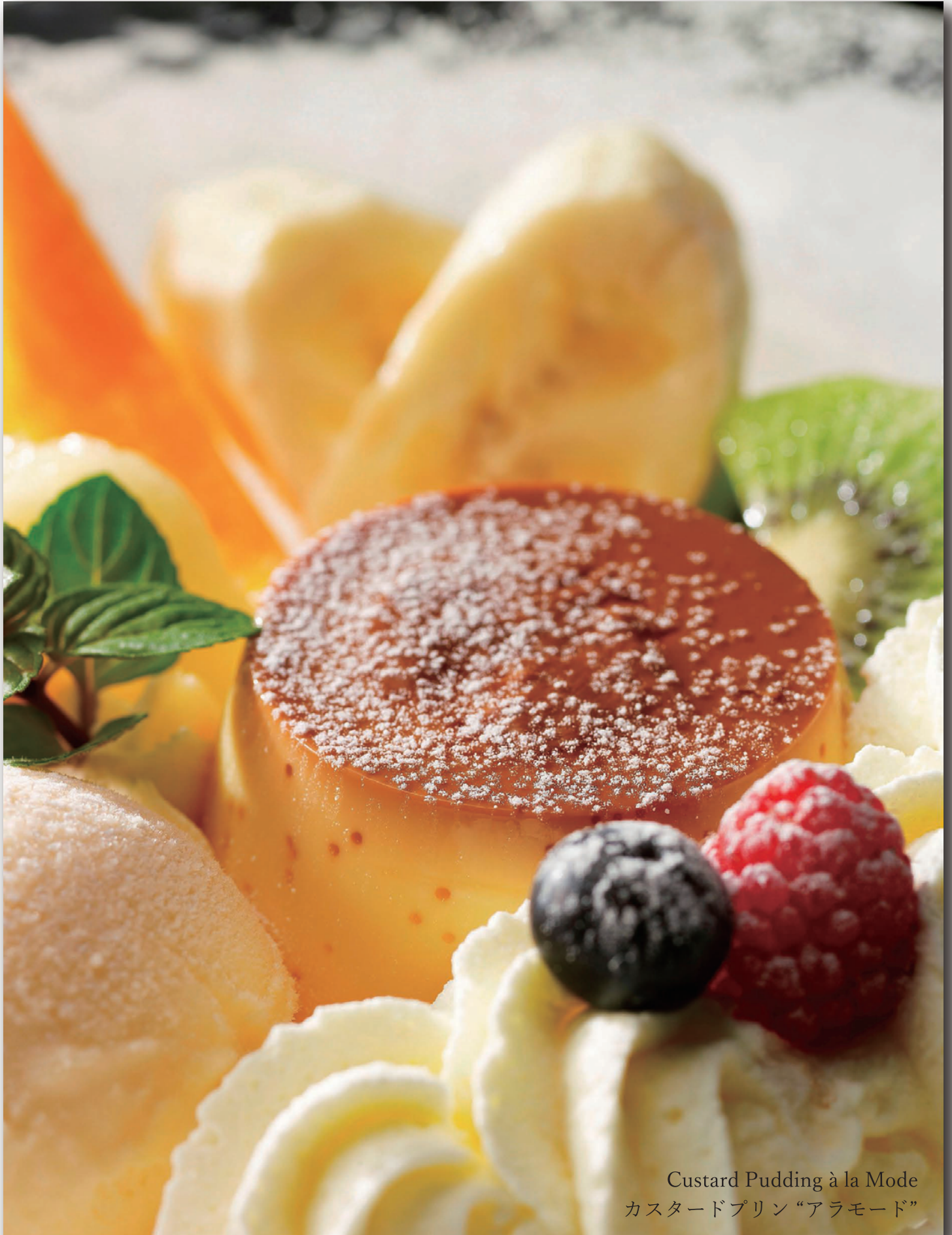
Custard Pudding à la Mode カスタードプリン “アラモード”