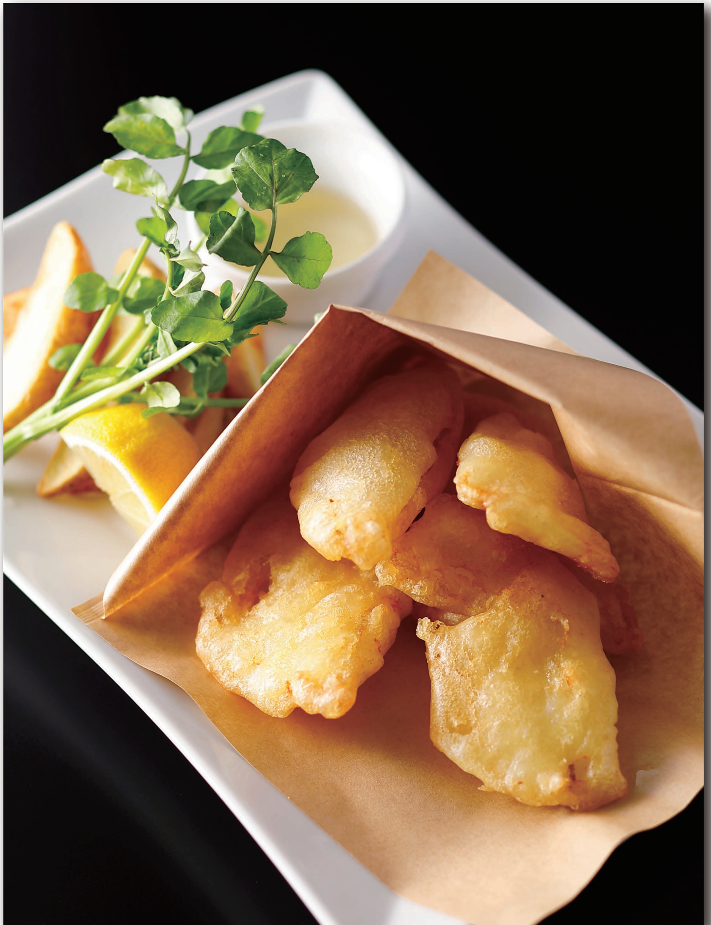
Fish and Chips フィッシュ&チップス