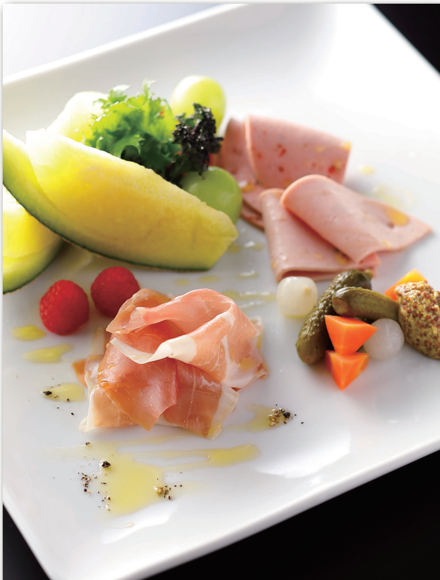
Prosciutto di Parma and Assorted Cold Cuts 生ハムとコールミートのデュエット