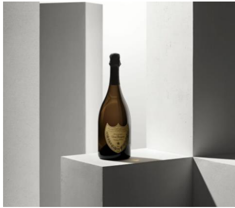
ドン ペリニヨン ヴィンテージ Dom Pérignon Vintage

“時”が生み出すエレガントで透明感のある ヴィンテージ。ユーカリ、ミラベルプラム ペッパーとカルダモンの繊細な香りが 色とりどりに複雑に絡み合います 口当たりはエレガントで贅沢なまでの シンプルさと精密さを表現します