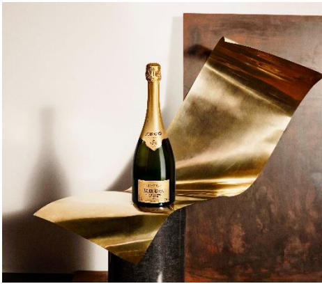
クリュッグ グランド キュヴェ Krug Grande Cuvée

20年以上もの歳月を費やして造られた プレステージ・シャンパーニュ 芸術にも喩えられるアッサンブラージュと 7年にも及ぶ長く静かな熟成を経て 単一年だけのブドウでは表現しきれない 独特の深く豊かな味わいが生まれます