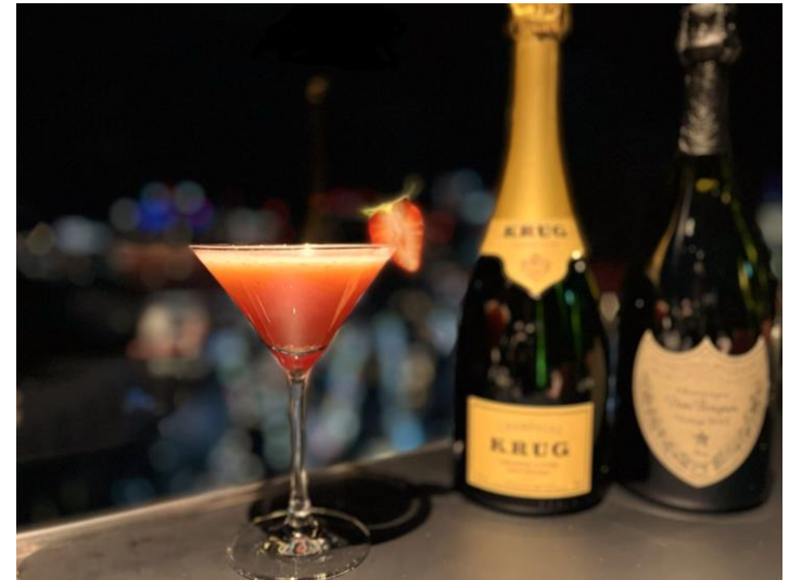
シャンパーニュ カクテル “フリーズドノエル” Champagne Cocktail “Fraise de Noël”

福岡が誇るブランド「あまおう」をピューレ状にし、シャンパーニュを注いで完成させるカクテル シャンパーニュは厚みのあるドンペリニヨン、唯一無二の味わいのクリュッグからお選び出来ます あまおうと完璧なハーモニーを奏でる珠玉の一杯。食後のデザートカクテルとしてもおすすめです