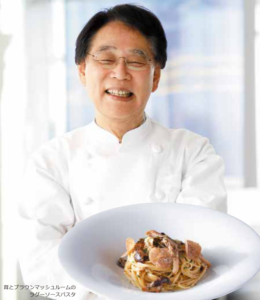
茸とブラウンマッシュルームの ラグーソースパスタ