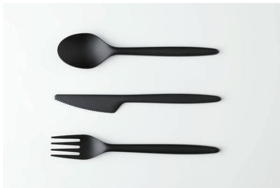
カトラリー (ナイフ・フォーク・スプーン)