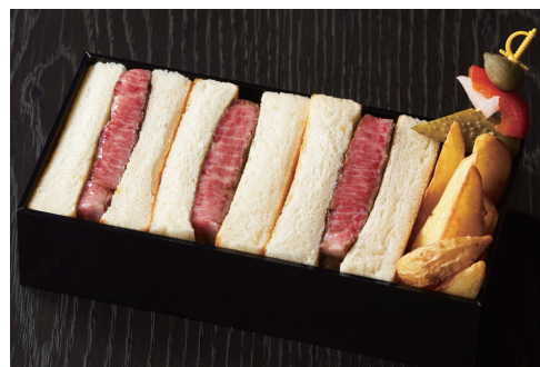
ステーキサンドウィッチ