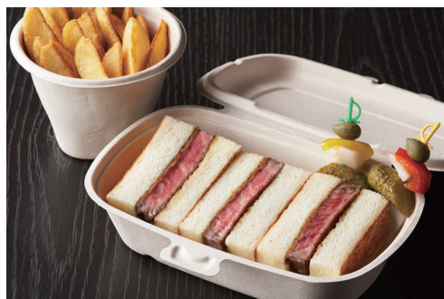
ヘレカツサンドウィッチ