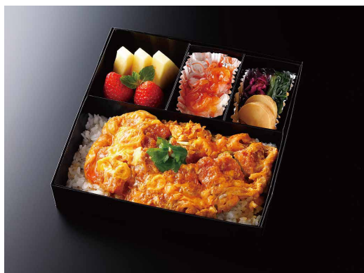
かつ重 (香の物/酢の物/果物) ¥ 3,600