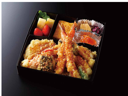
天重 (玉子焼き/香の物/酢の物/果物) ¥ 4,800