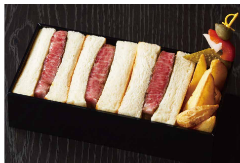
ステーキサンドウィッチ