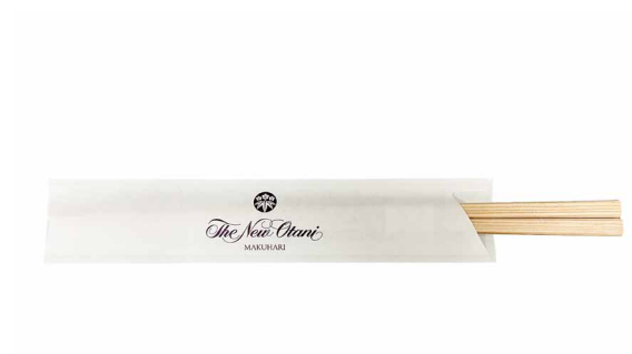
箸 ¥ 20