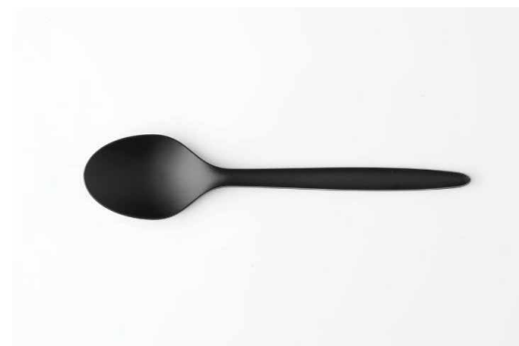
カトラリー (スプーン) ¥ 20

※2/28まで 3月以降は旬の味覚をお楽しみいただける季節のお弁当の 販売を予定しております。