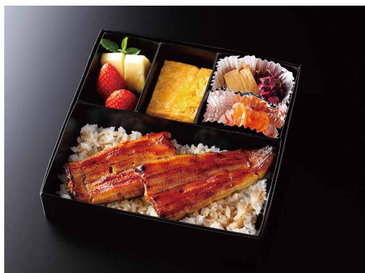
うな重 (玉子焼き/香の物/酢の物/果物) ¥ 8,000