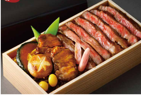
黒毛和牛3種の味わい弁当