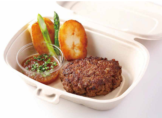
グランドビーフステーキ

黒毛和牛サーロインステーキ150g ¥14,000 黒毛和牛フィレスステーキ100g ¥18,000