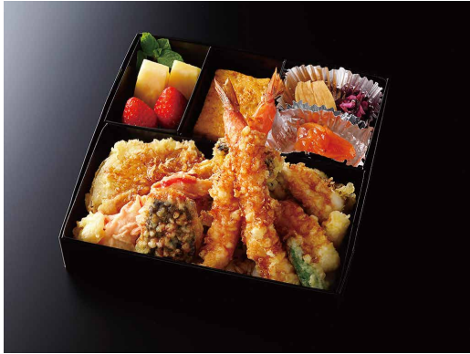
天重 (玉子焼き/香の物/酢の物/果物) ¥ 4,800