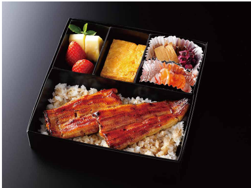
うな重 (玉子焼き/香の物/酢の物/果物) ¥ 8,000