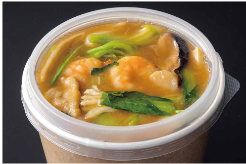
五目あんかけ焼きそば ¥2,700