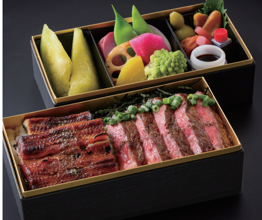
“極” 神戸ビーフ&うなぎ重 1折 ¥18,000