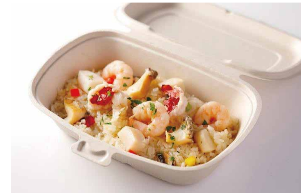
シーフードピラフ ニューバーグソース添え