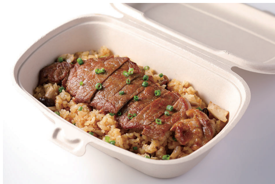
ビーフステーキピラフ