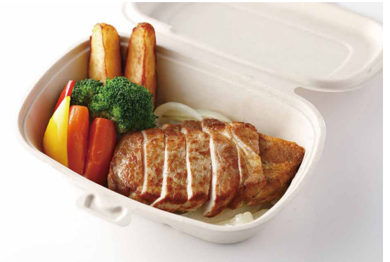
ポークソテー ガーリック醤油風味 ※ライス（白米・Jシリアル）又はパン付き