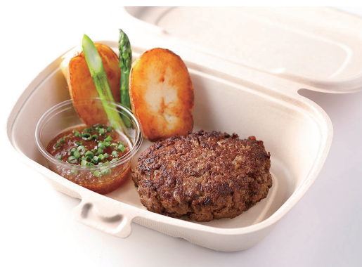
グランドビーフステーキ

黒毛和牛サーロインステーキ150g ¥14,000 黒毛和牛フィレステーキ100g ¥18,000