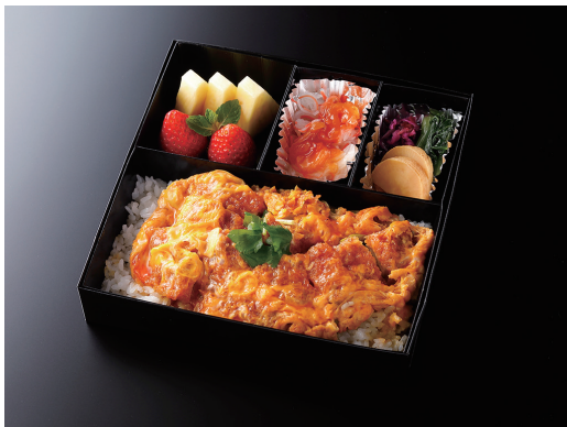
かつ重 (香の物/酢の物/果物) ¥ 3,600