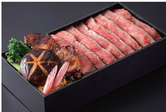
黒毛和牛3種の味わい弁当