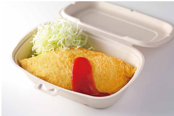
チキンオムライス