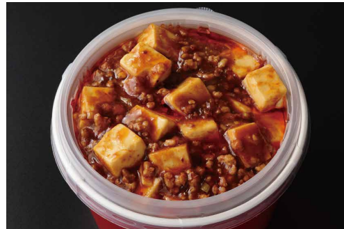
麻婆豆腐かけご飯 ¥3,500