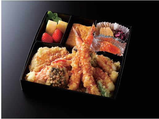
天重 (玉子焼き/香の物/酢の物/果物) ¥ 4,800