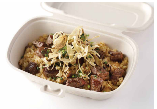
ビーフとキノコのピラフ ガーリック醤油風味