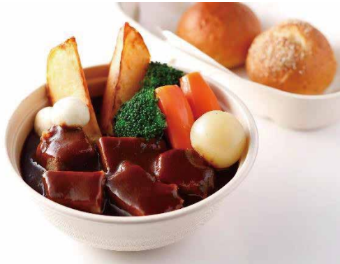
下町ビーフシチュー