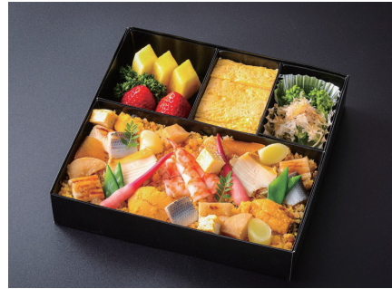
新江戸前ばらちらし (玉子焼き、小菜、果物付) ¥8,500