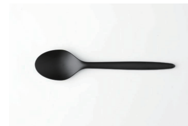
カトラリー (スプーン) ¥20