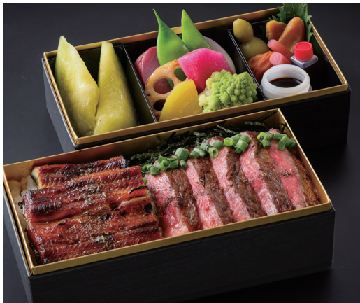
“極” 神戸ビーフ&うなぎ重 1折 ¥18,000