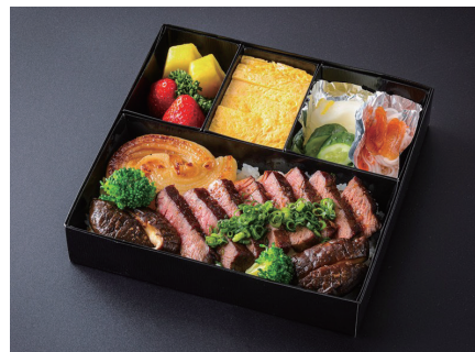
国産牛ステーキ重 (玉子焼き、香の物、酢の物、果物付) ¥8,800