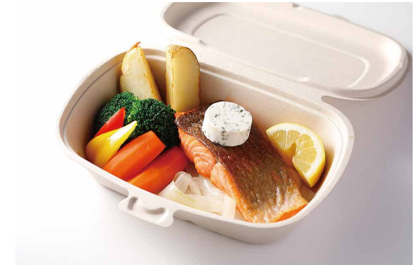
サーモンソテー ハーブバター添え ※ライス（白米・Jシリアル）又はパン付き