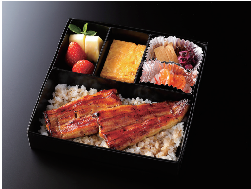
うな重 (玉子焼き/香の物/酢の物/果物) ¥ 8,000