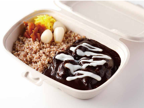
銀座ビーフカレー