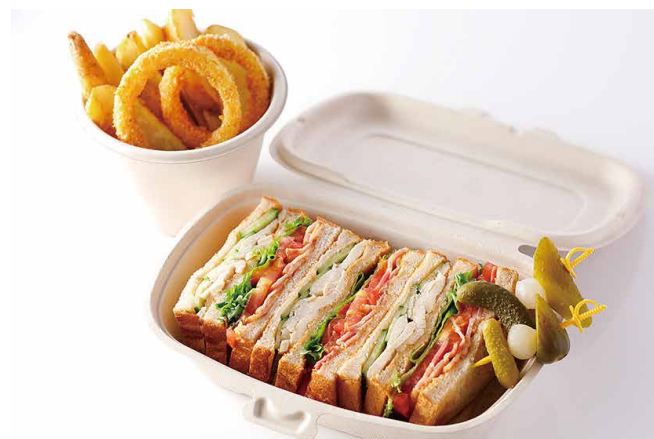
アメリカンクラブハウス サンドウィッチ