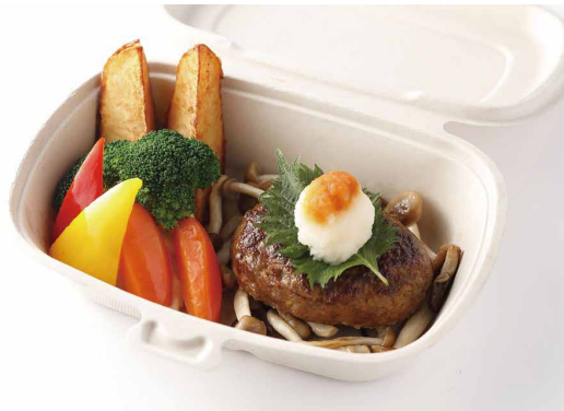
ハンバーグステーキ 和風ソース ※ライス（白米・Jシリアル）又はパン付き