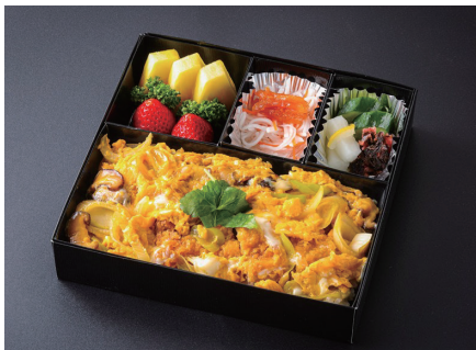
穴子かつ重 (香の物、酢の物、果物付) ¥4,800