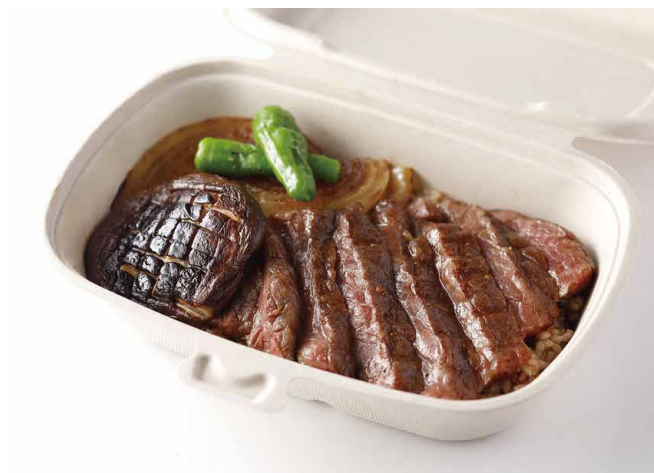
黒毛和牛の Jシリアルビフテキ丼