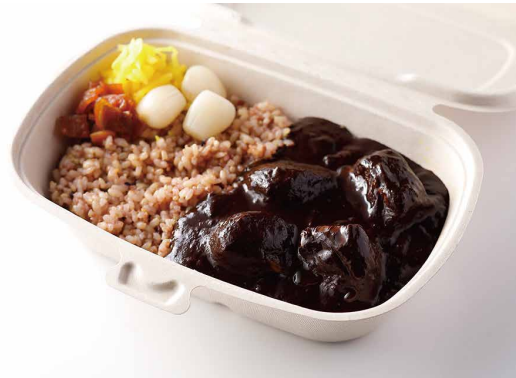
銀座シュリンプカレー