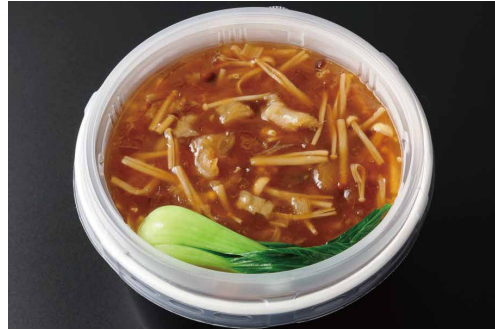
ふかひれ入りあんかけご飯 ¥7,000