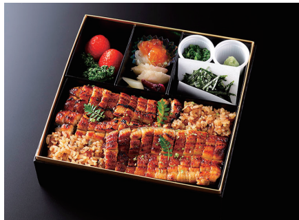
鰻まぶし (出汁、香の物、酢の物、果物付) ¥9,800