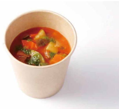
緑黄色野菜たっぷりの ミネストローネスープ