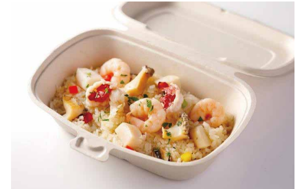
シーフードピラフ ニューバーグソース添え