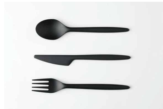
カトラリー (ナイフ・フォーク・スプーン) 各¥20