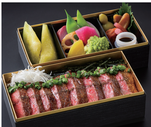
“極” 神戸ビーフ サーロイン重 1折 ¥15,000