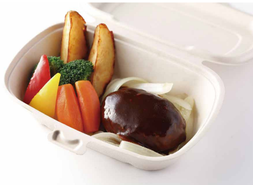
ハンバーグステーキ デミグラスソース ※ライス（白米・Jシリアル）又はパン付き