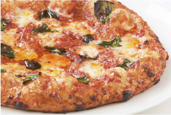
ピッツァ マルゲリータ Pizza Margherita