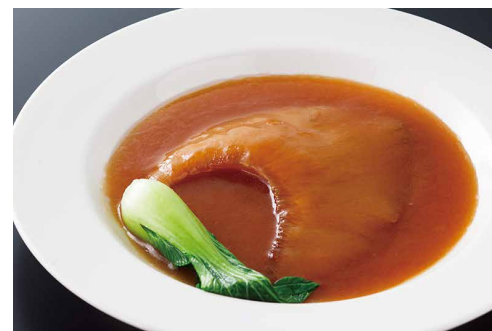
大観苑伝統ふかひれ姿煮 Braised Whole Shark's Fin