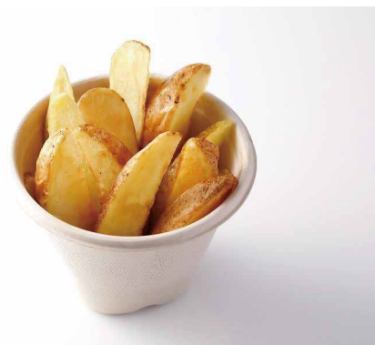
フライドポテト French Fries ¥ 1,000