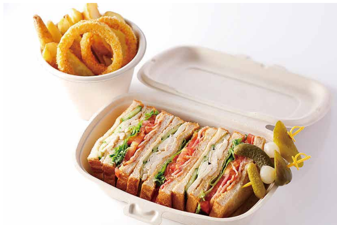
アメリカンクラブハウス サンドウィッチ American Clubhouse Sandwich