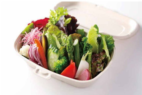
季節のフレッシュ野菜サラダ Seasonal Fresh Salad ¥ 2,100