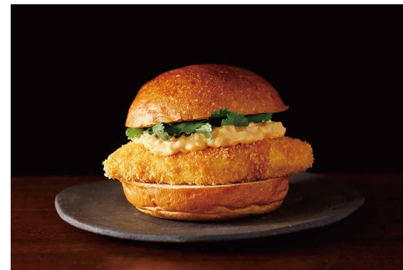
新東京フィッシュバーガー ※パクチー別添え ※フライドポテト付き Tokyo Fish Buger