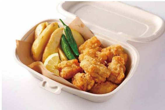
若鶏の唐揚げ フライドポテト添え Japanese-style Fried Chicken with French Fries ¥ 2,800