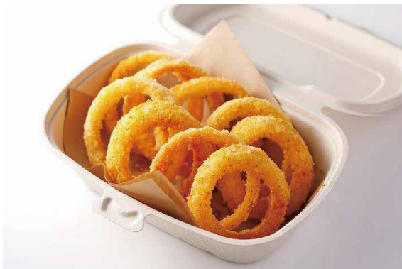
オニオンリングフライ Fried Onion ¥ 1,000