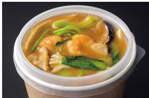
五目あんかけ焼きそば Fried Noodles with Seafood and Pork