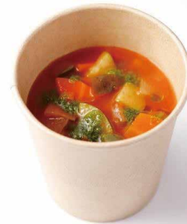
緑黄色野菜たっぷりの ミネストローネスープ Minestrone Soup ¥ 1,100