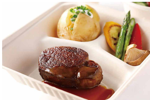
ステーキBOX Steak box 黒毛和牛サーロインステーキ150g ￥14,000 Japanese Black Beef Sirloin Steak(5.29oz) 黒毛和牛フィレスステーキ100g ￥18,000 Japanese Black Beef Fillet Steak(3.52oz)