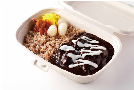
銀座ビーフカレー

※ライスを白米又はJシリアル米よりお選びください。 Old Fashioned Beef Curry with Steamed Rice ※Please choose white or multi-grain rice.