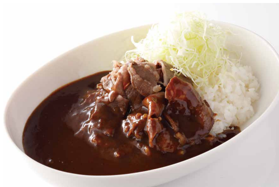
プレミアム甘口ビーフカレー Ground Iwate Shorthorn Wagyu Steak