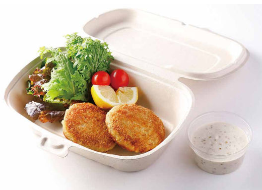
クラブケーキ (2個) Crab cake (2 Pieces)

¥ 1,800 (追加1個 ¥ 800) Additional charges 1 Piece ¥ 800