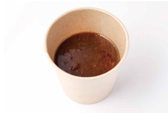
オニオンスープ Onion Soup ￥1,100