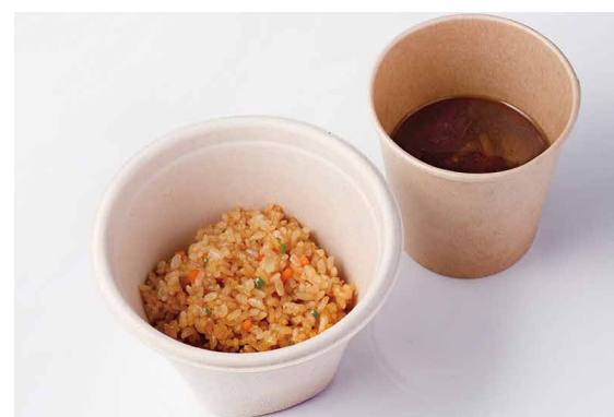
ガーリックライス ￥1,800 Garlic Rice ライス ￥550 Rice