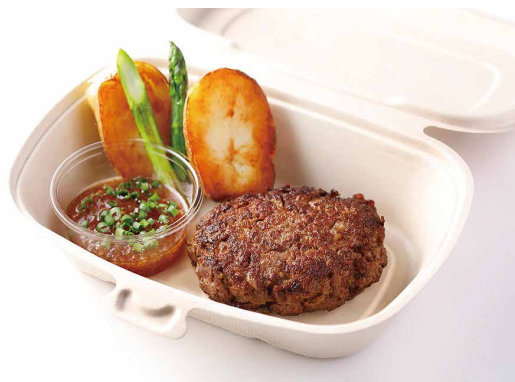
グランドビーフステーキ Grand Beef Steak ￥4,000