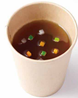
ビーフコンソメ Beef Consommé ¥ 1,400