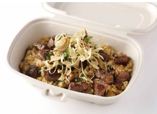
ビーフとキノコのピラフ ガーリック醤油風味

Beef and Mushroom Pilaf Flavored with Garlic & Soy Sauce