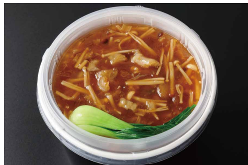
ふかひれ入りあんかけご飯 Steamed Rice topped with Shark's Fin and Starchy Sauce