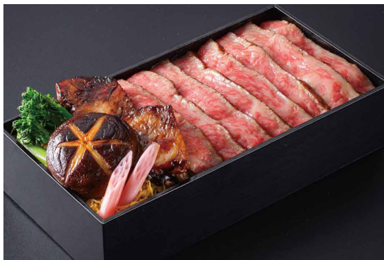
黒毛和牛3種の味わい弁当 Tasty Bento with 3 Kinds of Japanese Black Beef 1折 ￥6,000