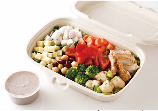
SATSUKIチョップドサラダ (クリーミーナッツ) SATSUKI Chopped Salad (Creamy nuts) ¥ 2,400