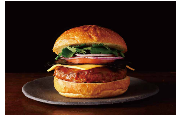
新東京バーガー 和牛パティ ※パクチー別添え ※フライドポテト付き Tokyo Burger (Wagyu Patty)