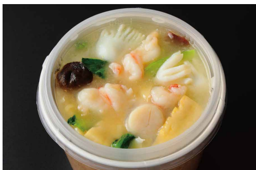
海鮮あんかけ焼きそば Fried Noodles with Seafood