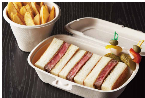
ヘレカツサンドウィッチ Fillet cutlet sandwich ※ロースのご用意もございます。 *Sirloin Steak is Also Available. ¥ 5,500