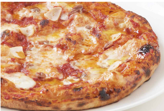
ピッツァ マリナーラ Pizza Marinara