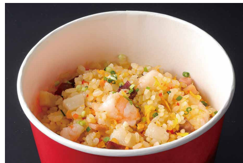
五目チャーハン Fried Rice with Shrimp, Pork and Vegetables