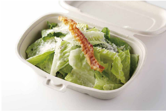
シーザーサラダ Caesar's Salad ¥ 2,100