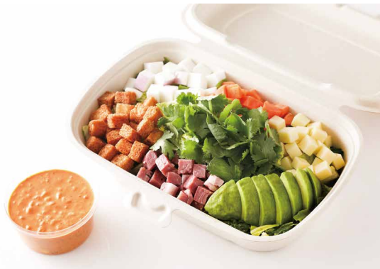
SATSUKIチョップドサラダ (スパイシーサウザン) SATSUKI Chopped Salad (Spicy Southern) ¥ 2,400