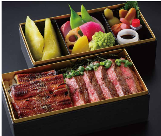
“極” 神戸ビーフ&うなぎ重 "KIWAMI" Kobe Beef and Eel Rice Bowl