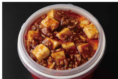
麻婆豆腐かけご飯 Steamed Rice with Spicy Braised Tofu with Minced Pork