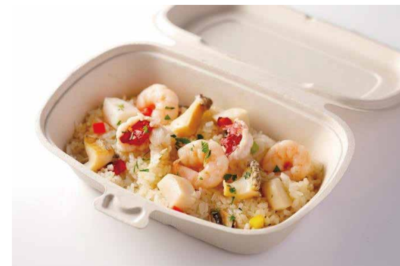
シーフードピラフ ニューバーグソース添え