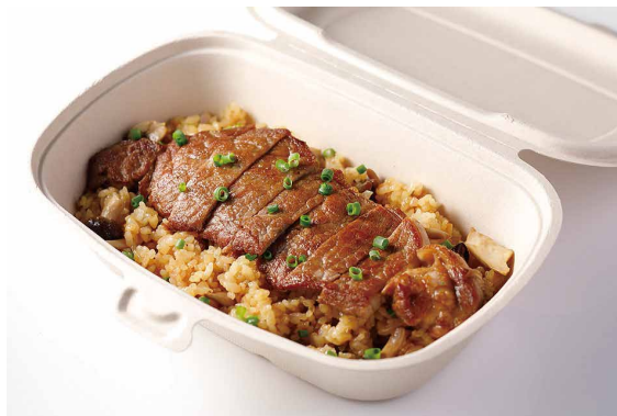
ビーフステーキピラフ Beefsteak Pilaf 黒毛和牛サーロインステーキ ￥6,000 Japanese Black Beef Sirloin Steak 黒毛和牛フィレスステーキ ￥8,500 Japanese Black Beef Fillet Steak