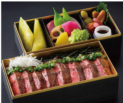
“極” 神戸ビーフ サーロイン重 "EKIWAMI" Kobe Beef Sirloin Rice Bowl