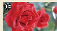
⑫ プレジデント L. サンゴール (フランス1978年) Président L. Senghor セネガル共和国初代大統領の名を授けら れた。