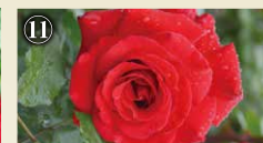
⑪ ビクトル ユーゴ (フランス1985年) Victor Hugo 19世紀フランスの文豪にちなんで名付け られた。花付きがよく、栽培しやすい品種。