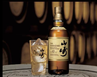
サントリー 山崎12年 THE YAMAZAKI Aged 12 Years

1923年以來の伝統をもつ山崎蒸溜所のモルトウイスキーは、花の春、繁る夏、紅葉の秋、雪の冬-彩り鮮やかな日本の四季を幾重にも眠ります。香りは複雑で力強く、華やかでノープル重厚で円やかなコグをもち、ウッディネス(樽熟木香)が心地よい余韻となって続きます。幾重にも広がる日本のシングルモルトウイスキーならではの味わいをぜひお楽しみください。